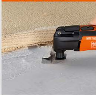
کندن پوشش و زیرسازی

با استفاده از کاردک فاین چسب ها و پوشش های اضافی شانس برای مقاومت نخواهند داشت.