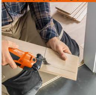
برش کفپوش و دیوارپوش

برش آسان، دقیق و تمیز پارکت، لمینیت و کامپوزیت با تیغه های فاین