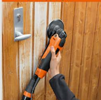
سنباده زنی بدون گرد و غبار

سنباده زنی بدون گرد و غبار با استفاده از رابط جارو برقی برای استفاده در محیط های داخلی