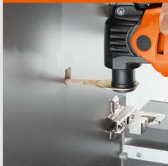
برش های دقیق و ریز

برش های دقیق و ریز حتی در کنج ها و گوشه ها - تیغه های دارای عرض ۱۰ mm