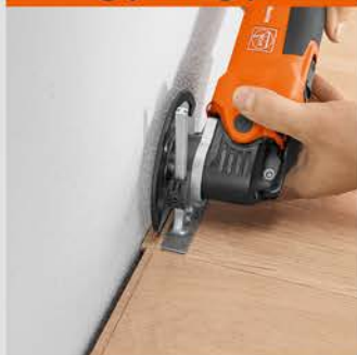
برش های متوالی

تیغه های گرد فاین به همراه محدود کننده عمق - مناسب برای تعمیرات