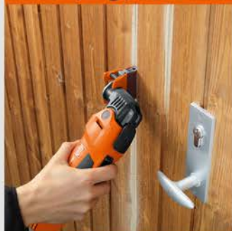
سنباده زنی شیارها

سنباده زنی شیارها با استفاده از تجهیزات جانبی گسترده فاین