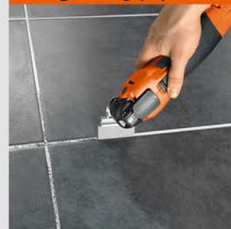
تمیز کردن بند کاشی

تمیز کردن سریع و آسان بند کاشی بدون کوچک ترین آسیب به کاشی